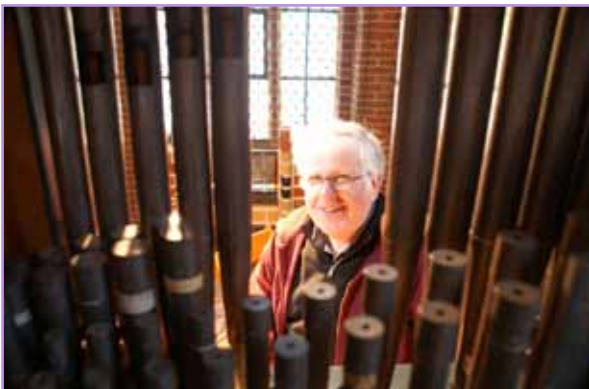
Orgelbaumeister Lenter hat die Chororgel in St. Nicolai neu intoniert.

erstmal nach über 50 Jahren - verwandelte unser Orgelbaumeister Gerhard Lenter im Mai den Chorumgang der Nicolaikirche in eine mobile Werkstatt. Neben neuen Dichtungen erhielt die